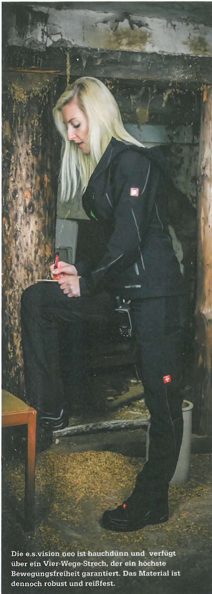
Die e.s.vision neo ist hauchdünn und verfügt über ein Vier-Wege-Stretch, der ein höchste Bewegungsfreiheit garantiert. Das Material ist dennoch robust und reißfest.

funktionell, bequem und langlebig. Die Hose bietet dieselben Features wie die der 2020-Linie und ist ab 57,00 Euro, je nach Größe, zu haben.