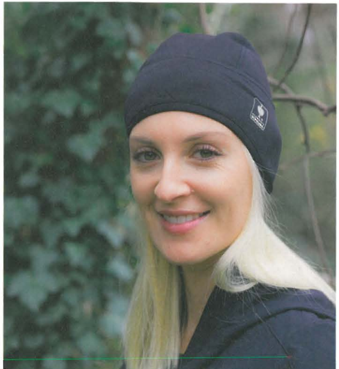
Als Vollsortimenter bietet Engelbert Strauss auch passende Mützen und Handschuhe in vielen Varianten.