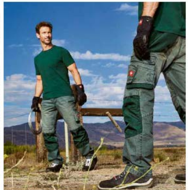
Entscheidend für den Handwerkerereinsatz ist die ausgefeilte Taschenausrüstung inklusive Zollstocktasche, Schenkeltasche und Handyfach.