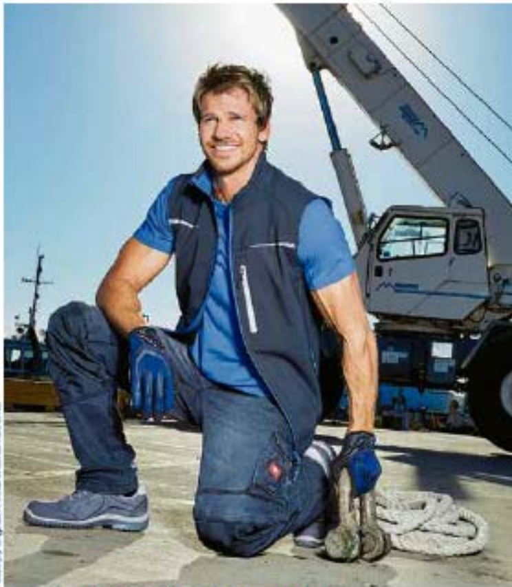
Legerer Cargoschnitt zeichnet die e.s. Workerjeans und -shorts aus.

Als Teil des e.s.-Baukastens verpassen sie jedem Team-Outfit den ganz besonderen, lässigen Charme und sind die ideale Kombi zu Shirts