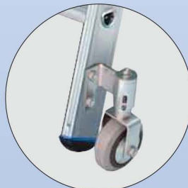
4 selbstarretierende 80 mm große Bockrollen