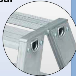
Stabile mehrfach verschraubte Aluminiumgelenke