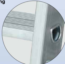
Neuartige, profilierte 80 mm tiefe Alu-Stufen fest verbördelt mit den Steigholmen